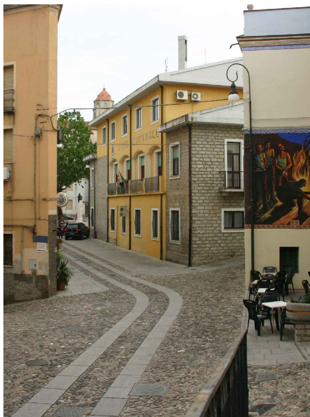
13 - Corso V.Emanuele verso Chiesa di Sant'Ignazio OGGI - 2010