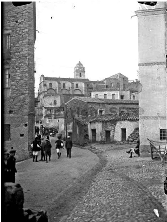
13 - Corso V.Emanuele verso Chiesa di Sant'Ignazio IERI - 1930